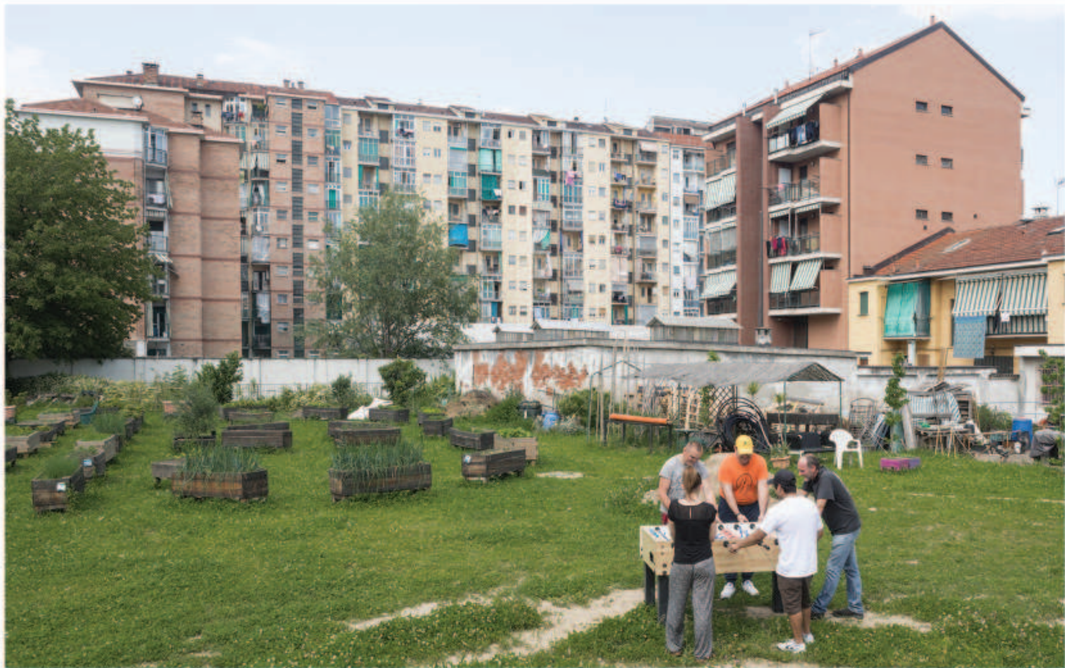
Torino, via Sospello 131/a