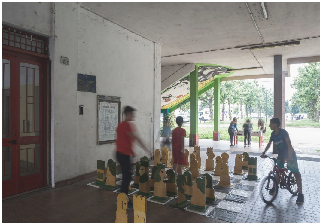
Torino, via negarville