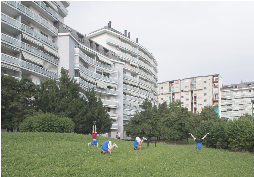
Torino, giardino Madre Teresa di Calcutta