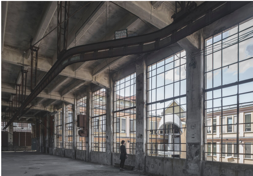
Torino, via Cumiana 15