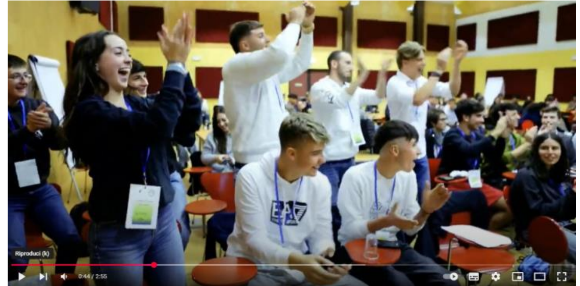
Evento di premiazione YCAF 4 ottobre 2024

E oggi attraverso questo secondo bando vogliamo che tu diventi protagonista del cambiamento!