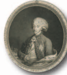
Carlo Emanuele IV e Maria Clotilde di Francia. Senza prole, il re rinuncia alla corona nel 1802 a favore del fratello Vittorio Emanuele I

Vittorio Amedeo III (1726 - 1796) - regna dal 1773 al 1796 sposa nel 1750 Antonia Ferdinanda di Borbone