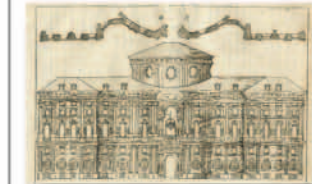
1750: apparati per il matrimonio (Collezione Simeom, I 9, D 639)