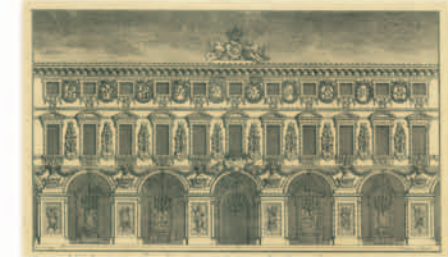
Maria Giuseppina di Savoia (1753 - 1810), figlia di Vittorio Amedeo III, sposa Ludovico conte di Provenza, futuro Luigi XVIII (Carte sciolte, 1105, 1106, Collezione Simeom, D 687, D 2074 - 2076)