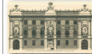
Vittorio Amedeo III e Antonia Ferdinanda di Borbone (Collezione Simeom, C 7332, 7367)