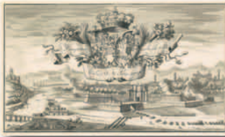
Matrimonio di Carlo Emanuele III con Maria Cristina Ludovica di Sultzbach. Illuminazioni realizzate da Filippo Juvarra