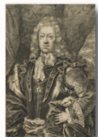
Vittorio Amedeo II e Anna d'Orleans

Carlo Emanuele IV (1751 - 1819) regna dal 1796 al 1802 sposa nel 1775 Maria Clotilde di Francia