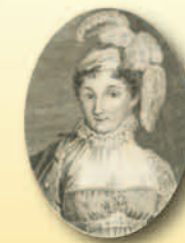
Vittorio Emanuele I (1759 - 1824) - succede al fratello nel 1802 - abdica nel 1821 sposa nel 1789 Maria Teresa d'Austria-Este