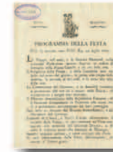
Programma della festa del 14 luglio 1800 (Collezione Simeom, C 2506)