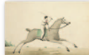
Apparati per le corse dei cavalli e divisa dei fantini (Collezione Simeom, D 2057; Carte Francesi, cart 103, f. 266)