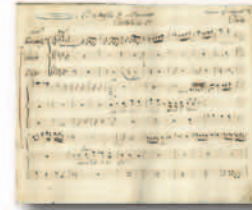
Spartito musicale (Carte francesi, cart. 102, fasc. 262)

Arco trionfale progettato da Ferdinando Bonsignore (Carte francesi, cart. 102 fasc. 262)