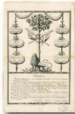
Albero della libertà (Collezione Simeom, C 8271)

Se le feste della prima occupazione francese (ottobre 1798 - giugno 1799) rivisitarono nostalgicamente modelli in Francia abbondantemente superati (alberi della libertà, balli e banchetti patriottici), nella fase successiva alla battaglia di Marengo esse risentirono del ritorno all'ordine dopo il furore rivoluzionario. Attraverso le feste il regime mirava alla creazione del consenso e al rafforzamento della sua immagine. Eventi politici o legati alla persona di Napoleone e della famiglia Bonaparte divennero così i frequenti pretesti per le feste che si articolano secondo modelli collaudati che comprendevano rituali celebrativi per le autorità e i notabili, e ludico-sportivi per il popolo.