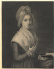
Carlo Emanuele IV e Maria Clotilde di Francia

Carlo Emanuele IV (1751 - 1819), sposa nel 1775 Maria Clotilde di Francia. Sale al trono nel 1796. Senza prole, rinuncia alla corona nel 1802 anno in cui muore la moglie