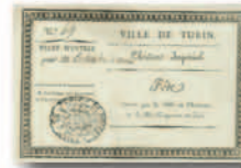
Biglietto d'invito alla festa organizzata dalla Città di Torino in onore di Napoleone I, 1805 (Collezione Simeom, C 2511)