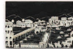
1808: Camillo Borghese a Torino. Posa della prima pietra del ponte sul Po. Découpure , 1810 (Collezione Simeom, D 2057)