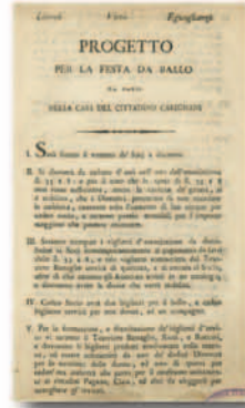
"Progetto" di una festa da ballo (Collezione Simeom, C 2504)