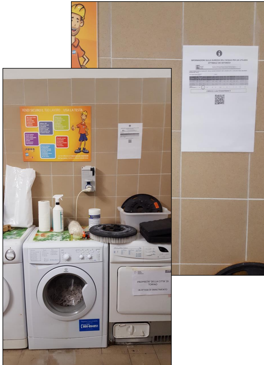
ALLEGATO CRITERIO N. 60 – INDICAZIONE DELLA DUREZZA DELL'ACQUA INFORMATIVA E DOCUMENTAZIONE FOTOGRAFICA