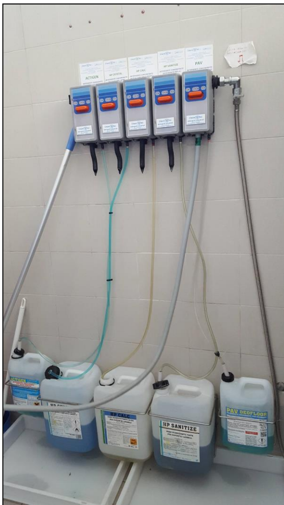
PIANO TERRA - CUCINA